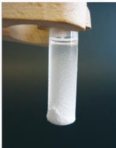
Sublimacja chlorku amonu